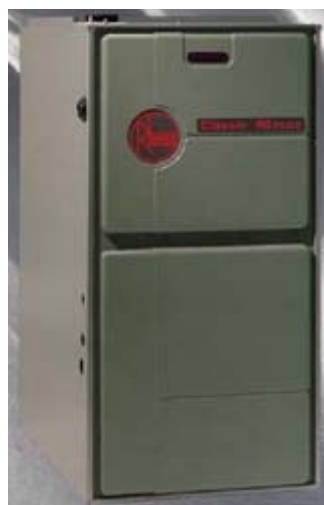
nagrzewnica gazowa Rheem®