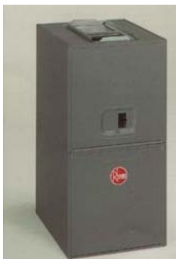
nagrzewnica elektryczna Rheem®

Ogrzewanie nadmuchowe jest systemem centralnego ogrzewania i zarazem wentylacji, w którym medium grzewczym jest powietrze krążące w ogrzewanym obiekcie w układzie pełnej lub częściowej recyrkulacji. Sercem systemu jest nagrzewnica powietrza, która podgrzewa je oraz wymusza jego ruch. Przefiltrowane powietrze po ogrzaniu, nawilżeniu lub schłodzeniu (przy klimatyzacji) jest transportowane kanałami nadmuchowymi i wdmuchiwane bezpośrednio kratkami nawiewnymi do pomieszczeń użytkowych. System posiada możliwość dozowania ilości powietrza zewnętrznego dostarczanego do pomieszczeń użytkowych w zależności od pory roku i potrzeb w granicach od 5 do 50%. Powietrze dopływające do strefy przebywania ludzi posiada parametry (temperatura, wilgotność, czystość) na dużo wyższym poziomie, niż w przypadku innych metod ogrzewania. W sezonie letnim ten sam system może pracować jako wentylacja mechaniczna w wersji podstawowej lub ze schładzaniem powietrza w wersji z klimatyzatorem.